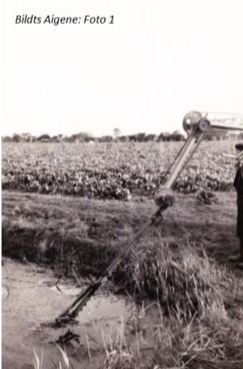
Bildts Aigene: Foto 1