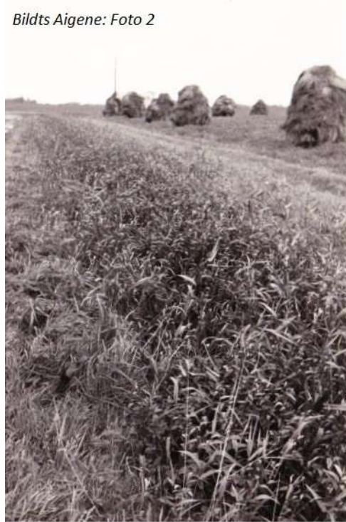
Bildts Aigene: Foto 2